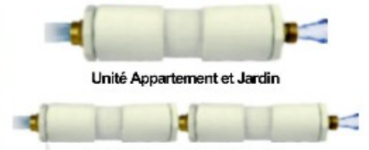
Unité Appartement et Jardin